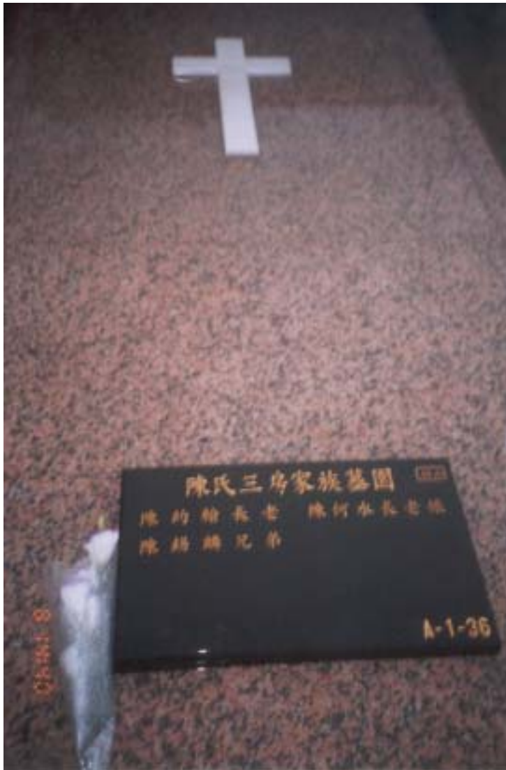
照片 8 陳氏三房家 族墓園（平安園內）