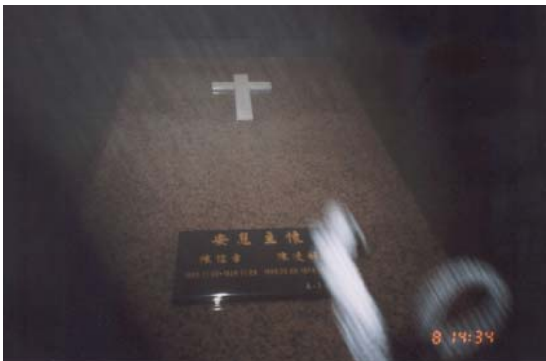
照片 6 陳信章之妻陳凌好遷葬金山基督教平安園（合葬，空位 70 萬元）