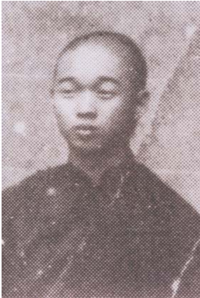
照片 1 陳水龍像