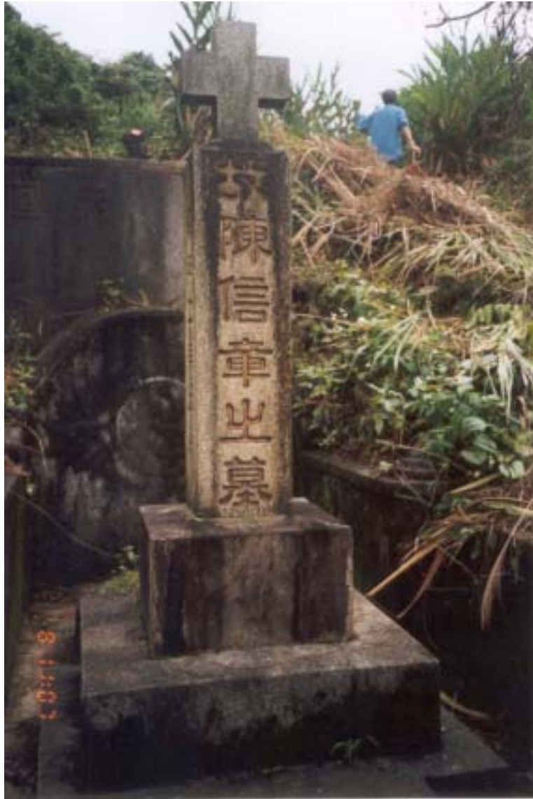
照片 5 松山公墓上之陳信章墓