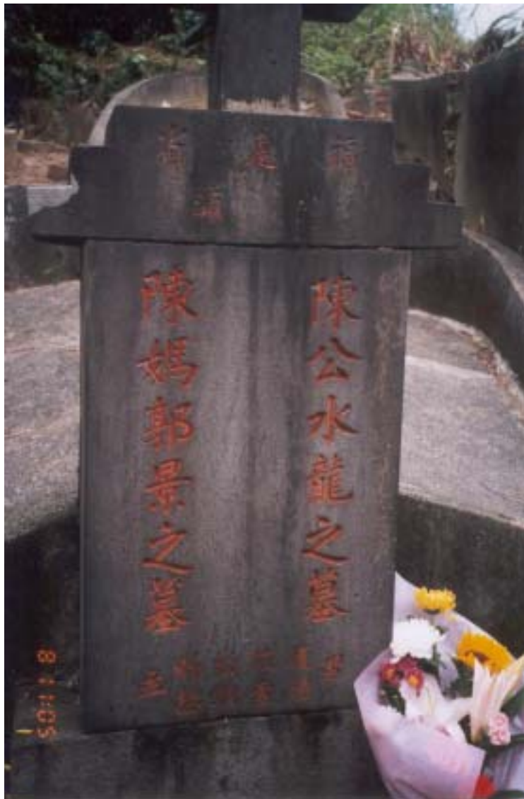
照片 2 陳水龍和妻子之墓（松山公墓）